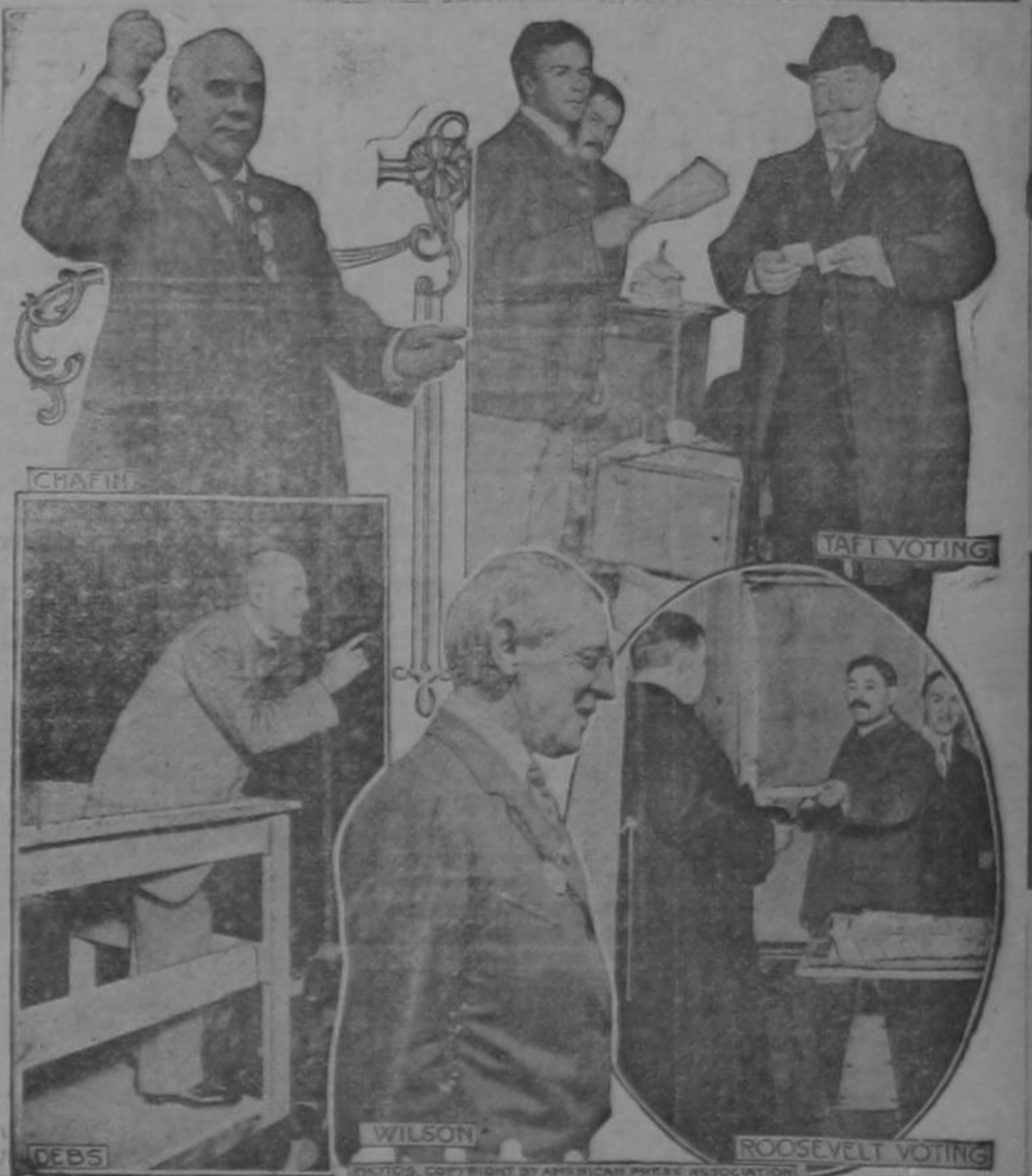
EJERCITANDO EL SUFRAGIO

Taft, Roosevelt y Wilson en el momento de depositar su voto