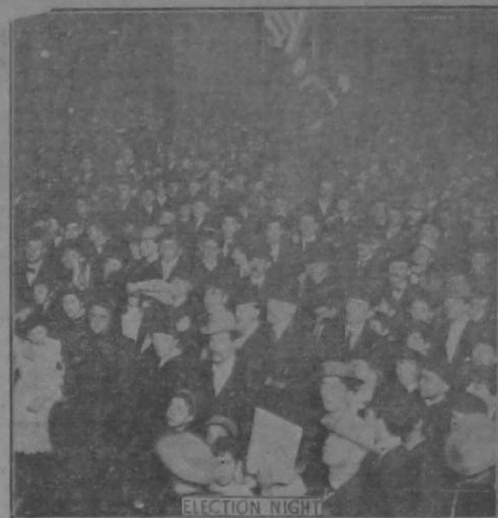
Una vista de la multitud en New York mientras se esperaba el resultado de las elecciones.

El Jueves 28 Estreno de la reducción de la bella ópera LOS MOLINOS DE VIENTO, por Ramiro Pérez. Véanse los programas.