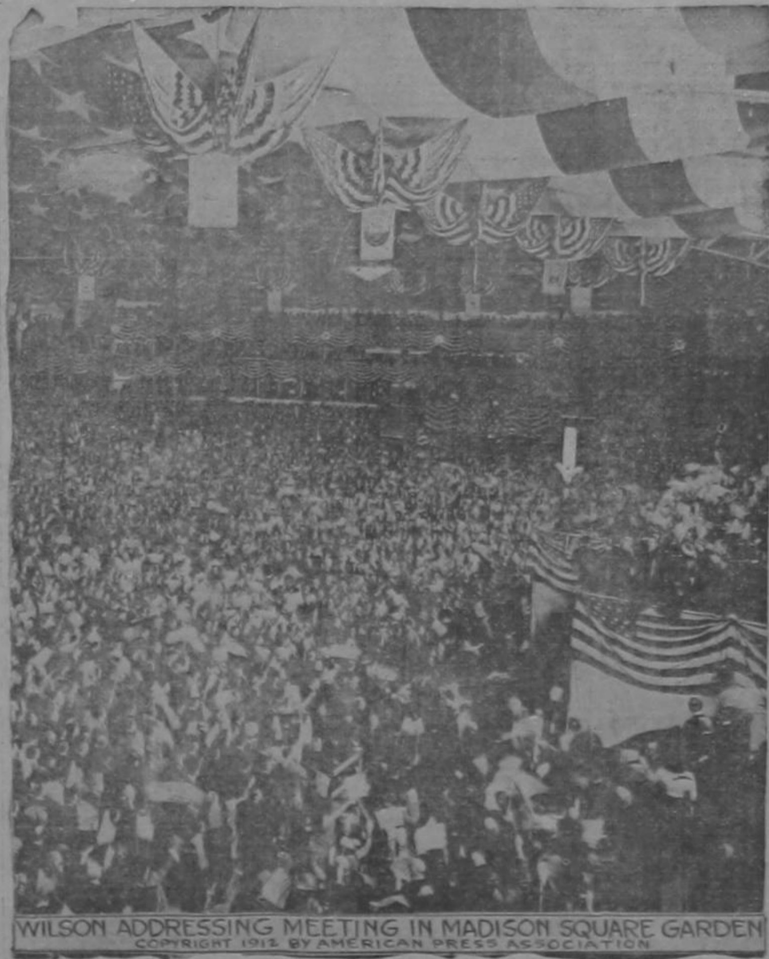
WILSON ADDRESSING MEETING IN MADISON SQUARE GARDEN

INFORMACION GRAFICA DE LOS SUCECOS CULMINANTES EL GRAN PROBLEMA en el MOMENTO de su RESOLUCION